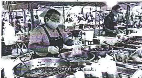
ข้อชุดที่ ๒ ทางรอด